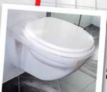
URIN- UND KALKSTEINENTFERNER